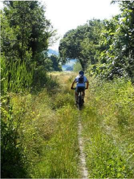
Single track lungo i Piani d'Aspio