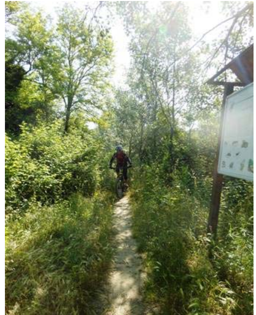
Single track sulle rive del fiume Musone