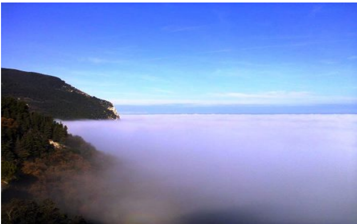
Il Monte Conero dalla piazzetta di Sirolo, in una giornata invernale