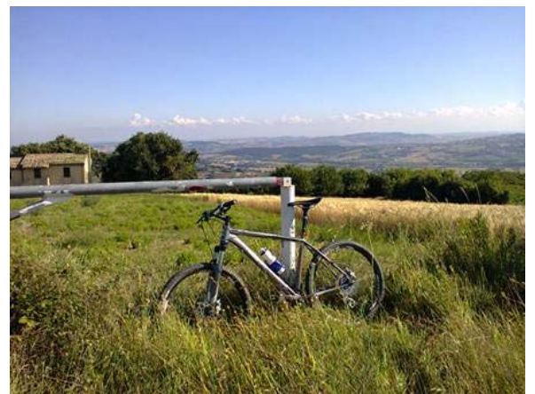
Panorama a 360° dalla coma del Monte Colombo