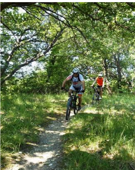
Discesa dal Monte Colombo