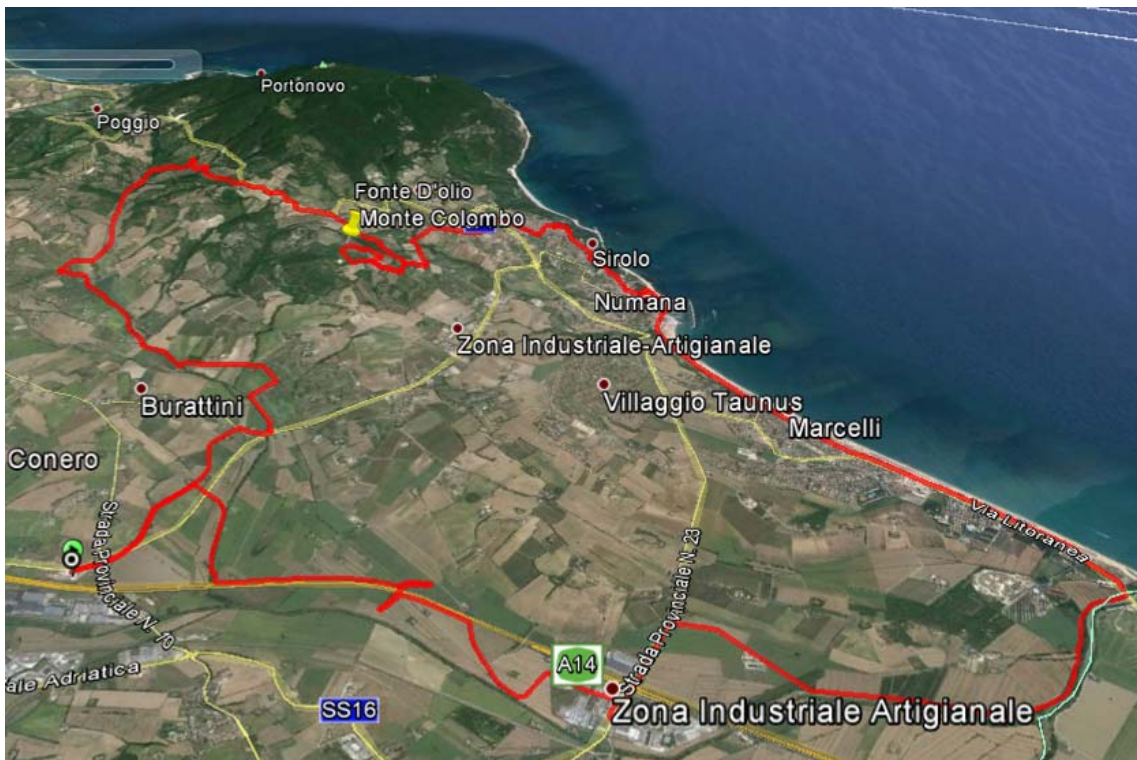
Mapa del percorso