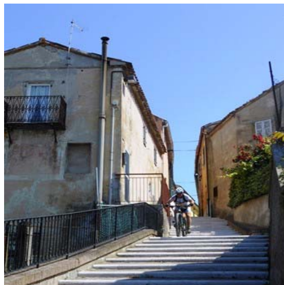
Scalinata a Massignano